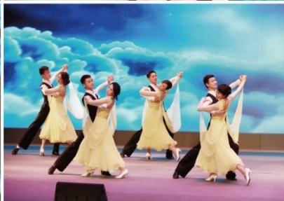
华工EMBA女生协会慧兰荟周年庆活动现场