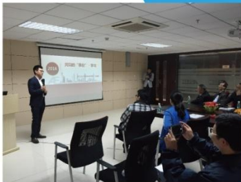
(一) 见识比学识更重要

相比其他教育项目，EMBA是针对企业高级管理人员进行系统化的在职培训，更注重提高学员的决策洞察力和战略管理水平，为学员们带来全球化的思维大碰撞，拓宽国际视野。